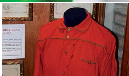
I Mille di Garibaldi a "trazione Orobica" pag. 4